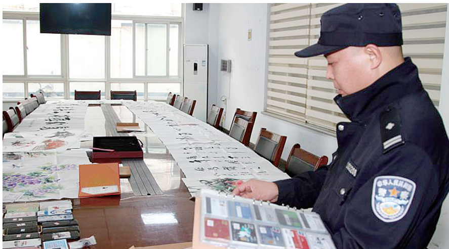
警方查获的假名家字画

该公司员工经过统一的“话术”培训后,不断通过交友软件添加有发财“梦想”的人,并大力鼓吹一款名为“蜻蜓商城”APP,可以在该平台规定时间内抢购“名家”字画赚钱。例如,买家上午在该网站下单,购买起步价1000元的“名家”字画,下午就可以看到升值5%,然后再次挂到网上加价去出售。第二天,便会有人“抢购”该幅字画,而买到画的人可以再次加价销售。以此类推,每次买卖只需向平台支付3%的手续费,剩余2%差价就是购买人赚到的净利润。