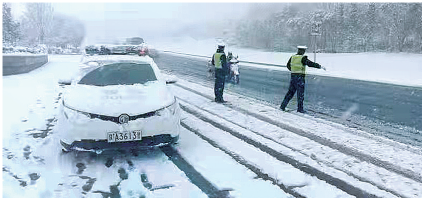
登封交警在雪中指挥交通

本报讯(郑报全媒体记者 张玉东文/图)昨日上午,郑州市首降瑞雪,导致路面湿滑。郑州交警启动恶劣天气预案,全员上岗,顶风冒雪指挥疏导,确保道路安全畅通。