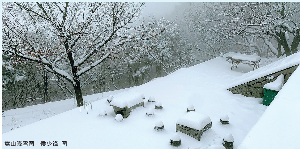
嵩山降雪图

本报讯(郑报全媒体记者 武建玲)“嵩山白雪皑皑”“东区雪下大了”“西区也下雪了”……昨日上午,不少人在朋友圈晒起了郑州下雪的照片和视频。上午11时许,郑州市气象部门官宣:“今天的降雪是郑州的初雪!”