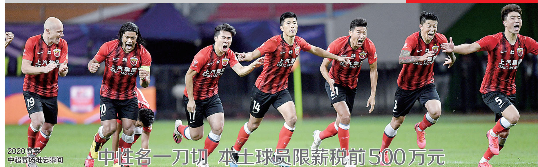
2020赛季 中超赛场难忘瞬间