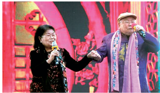
豫剧名家、“拴宝”扮演者王善朴(右)

王善朴老人是国家一级演员、“豫剧现代戏第一小生”,著名诗人王怀让曾高度评价:“拴保止于王善朴”。但这些年来,他却因罹患白内障、眼底病,让他一生热爱的艺术生活蒙上了“阴影”。 蒋晓蕾