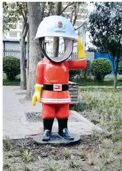
快来打个卡:我是消防员

这一宣传阵地将立足普及消防安全常识、应急避险和自救互救技能,切实提升公众应急素质和消防安全水平,进一步推进消防安全专项整治三年行动的开展。