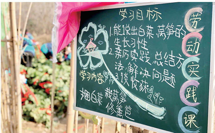
“劳动”和“教育”相遇成课程

“十三五”期间,郑州市“道德课堂”以其多元与包容,激发了学校的实践创新。“道德课堂”实践成果被评为基础教育国家级教学成果奖二等奖,入选教育部基础教育课程教材发展中心基础教育课程改革典型案例库。