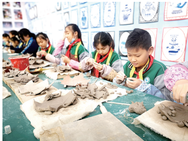
巩义市紫荆实验小学陶艺社团很火