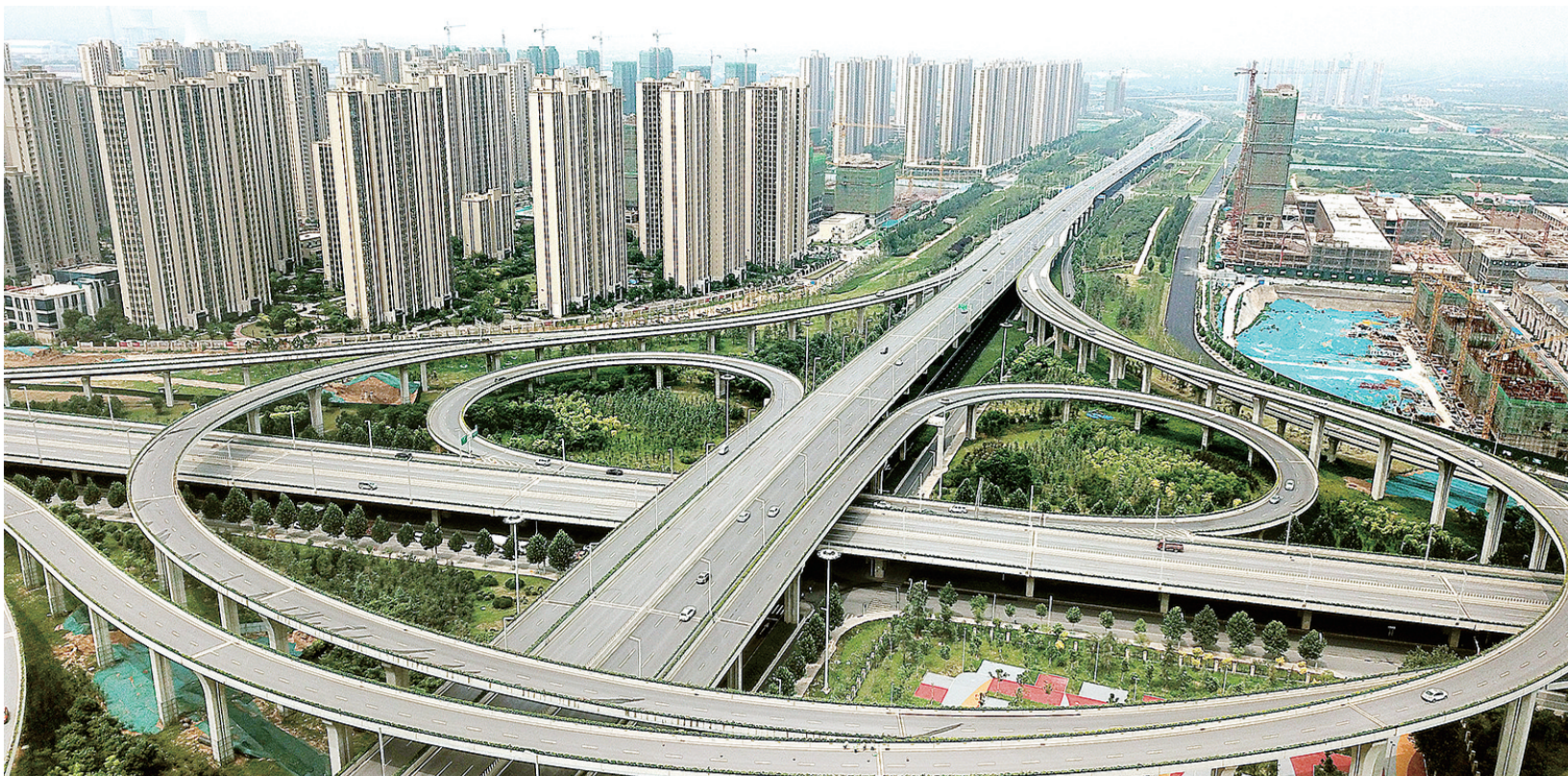
西四环陇海路立交