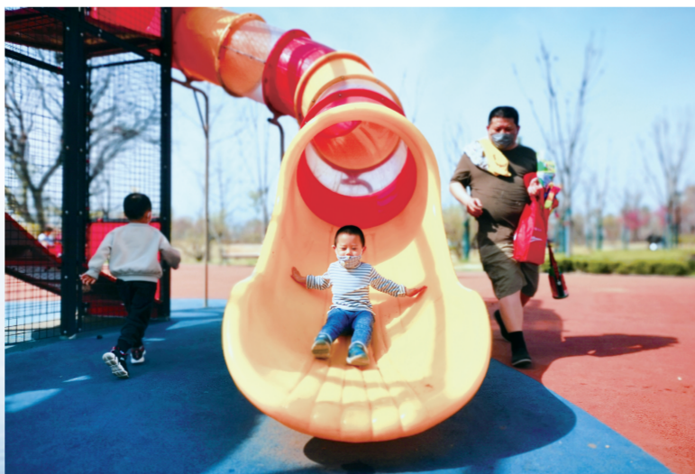
小朋友在游园内玩耍