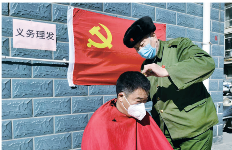
志愿者走进社区义务为居民理发