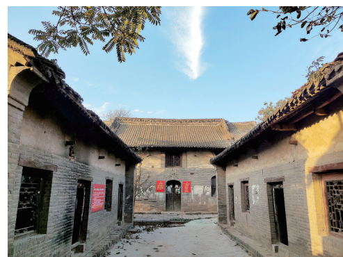
“中共登封红一大”旧址