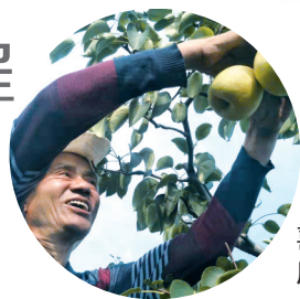
喜上眉梢 唐彩红 图

明洪武年间,袁氏先祖袁克诚带领妻子儿女全家11口人从山西洪洞县移民来登封,居住在这里。因村东沟内常年流水,于是,袁克诚举家动手在河沟上修筑了一座石拱小桥,“袁桥”的名字也由此诞生。