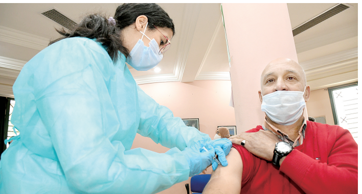
一名男子在摩洛哥首都拉巴特一处疫苗接种站接种中国国药的新冠灭活疫苗

新华社电 来自英国牛津大学等研究机构的最新统计数据显示,随着多国陆续大规模开展新冠疫苗接种,全球累计接种了约1.049亿剂新冠疫苗,而全球累计确诊病例数约1.041亿例。