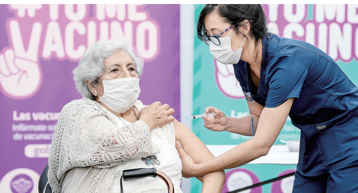
一名老人在智利圣地亚哥市中心一家疫苗接种中心接种中国科兴公司生产的新冠疫苗