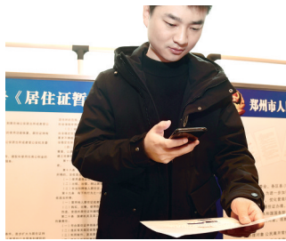
一居民网上申领居住证

办理郑州居住证不再完全受“居住登记满半年以上”限制,可快速核发,满足相应条件15日内可拿证……为全面深化“放管服”改革工作,郑州市公安局针对“居住登记满半年办理居住证”的条件在一定程度上影响了流动人口的幸福感、归属感问题,推出了5项惠民新举措。2月25日上午,郑州市公安局举办“网上快速核发居住证”新闻发布会,公布相关政策。郑报全媒体记者 张玉东 见习记者 刘地 通讯员 张芳冰/文