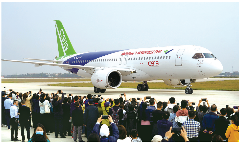
2020年10月31日,国产大飞机C919在跑道上滑行

作为一家拥有750余架飞机、全球排名前十的航空公司,东航接收一款新机型还将对飞机进行全面深入的“检验”。对于C919而言,这无疑是在进一步完善型号以符合市场需求的契机。