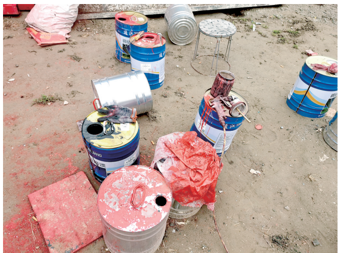
大智租赁漆桶敞口放置

本报讯(郑报全媒体记者 张玉东 见习记者 刘地 郑州电视台记者 王京 文/图)3月1日,郑州市污染防治督导组三处对新密市落实重污染天气黄色预警管理措施有关要求进行了督导检查,共检查企业3个,均存在问题,执法人员开具督企交办单3张。