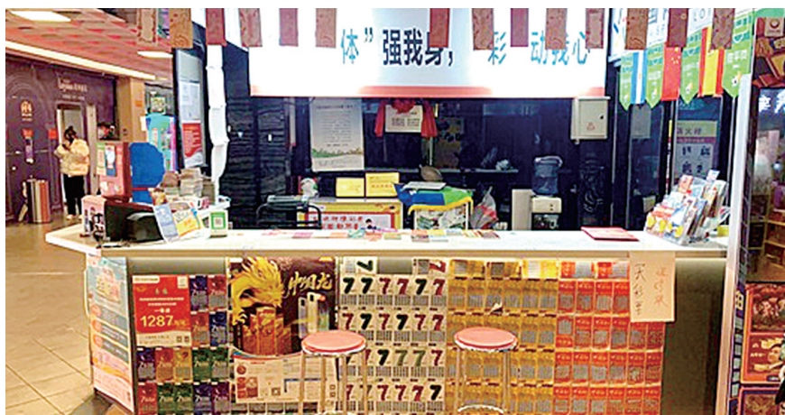
独具特色的体彩店给购彩者不一样的感受

温馨舒适的购彩环境,闪亮醒目的成绩荣誉展示墙,闪光亮丽的顶呱刮即开票销售展示区,都会给购彩者不一样的感受。