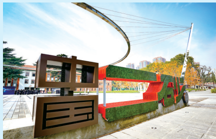
郑州中国二砂文创园