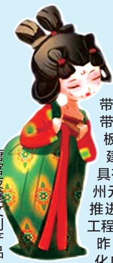
唐宫夜宴文创产品

系列展示黄河文化、郑州特色的精品力作。同时办好“中国(郑州)黄河文化月”活动，塑造中国(郑州)国际旅游城市市长论坛、中国诗歌节等文化旅游节事活动品牌；积极创建联合国教科文组织全球创意网络城市；加快培育一批具有国际影响力的文化、体育、展会、赛事品牌；着力提升功夫、河洛、根亲等国际知名文化符号的世界知名度。