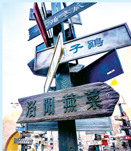
建设中的《只有河南·戏剧幻城》景区