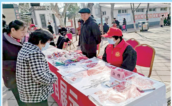
3月4日,非遗项目展示吸引了众多市民。