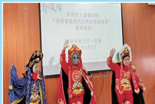
3月4日,郑州市儿童福利院开展“送文艺节目”主题实践日活动,特教教师表演“变脸”节目。