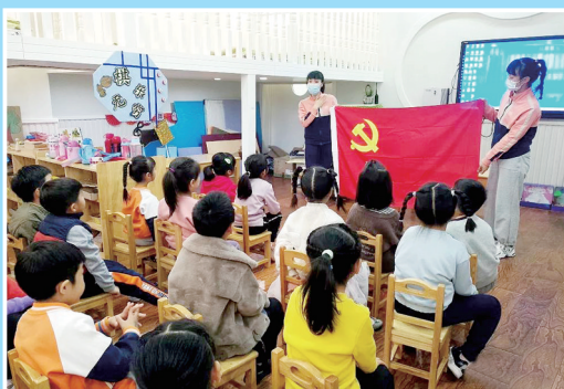
3月3日,方圆经纬社区新时代文明实践站走进经纬花园幼儿园,为孩子们带来“识党旗、讲党旗、画党旗”文明实践主题教育课。