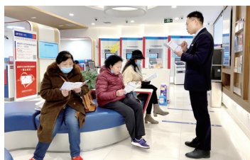
为老年人撑起“关爱伞”

为不断加强消费者保护,强化消费者教育,全力维护经济金融安全和消费者合法权益,将金融教育宣传活动与推动金融服务适老化相结合,3月15日,浦发银行郑州分行联合未来路派出所、未来路街道名门世家社区在浦发国际金融中心3楼会议室举办了2021年“3·15”消费者权益保护教育宣传防诈骗讲座活动,未来路片区金融机构代表、周边社区中老年居民参加了本次活动。 郑报全媒体记者 倪子 张俊 通讯员 张星辰