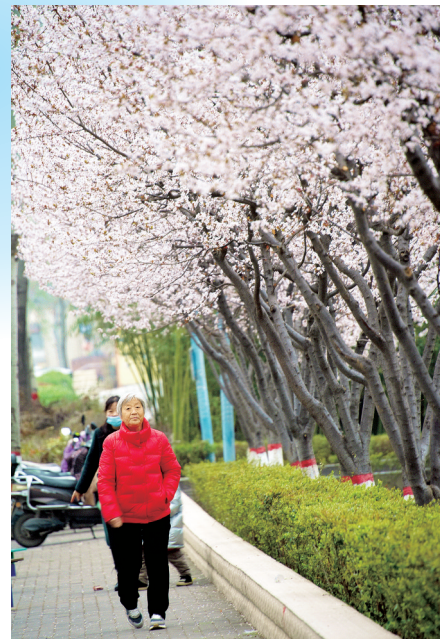
市民深入花开的季节 赏花地点:登封市区嵩阳街道