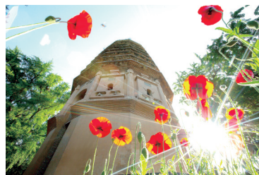
古刹下的虞美人 赏花地点:嵩山景区嵩岳寺塔