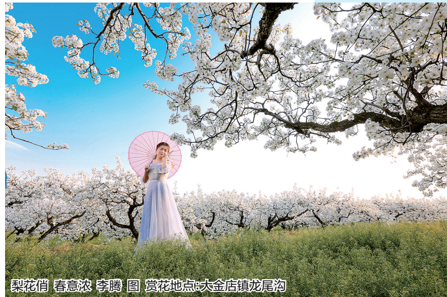
梨花俏 春意浓 赏花地点:大金店镇龙尾沟