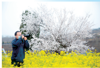
摄影师陶醉花海之中 赏花地点:宣化镇荟萃山村