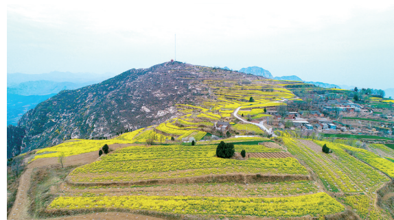
满山开满油菜花 赏花地点:白坪乡天雄古寨