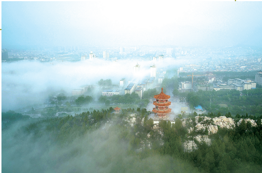
云雾缭绕登封城