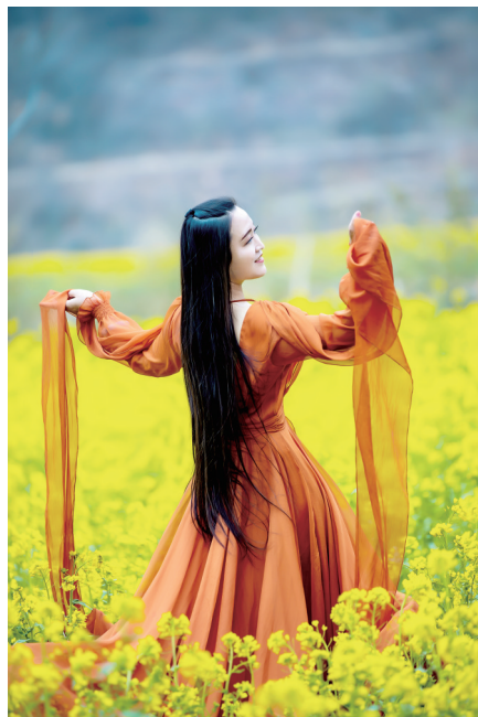
花海中翩翩起舞 赏花地点:徐庄镇柏石崖村

阳春三月,梨花、桃花、油菜花等竞相开放。告别喧嚣的城市,外出踏青,暂时抛却烦忧,呼吸新鲜空气,是最美不过的事情。 登封融媒记者 付文龙