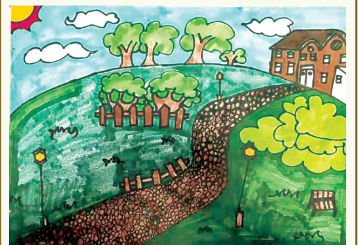
故乡小路 告成镇镇直小学二四班 宋晨曦