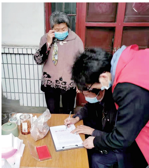
上门帮助办理高龄津贴认证

“我们以精准服务为核心,切实解决企业经营发展中的困难和问题。”新华路街道党工委书记刚表示,“今年前两个月,新华路街道服务专班深入辖区50多家企业走访调研,对企业诉求进行梳理,一一列出清单,及时落实解决,为企业上项目、发展壮大扫清障碍。”