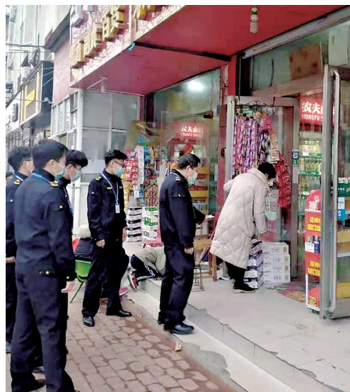
帮助商户优化经营环境