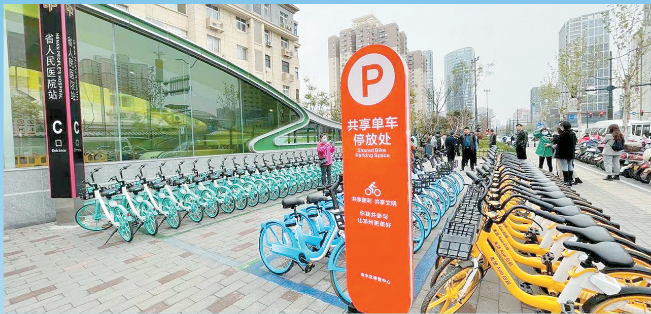
共享单车停放点整齐有序

本报讯(郑报全媒体记者谷长乐 文/图)本月起,新型共享单车亮相郑州街头,与之配套的是规范的共享单车停放点。不少市民认为规范有序,解决了乱停乱放现象,也有不少市民反映“找车难”“停车麻烦”。