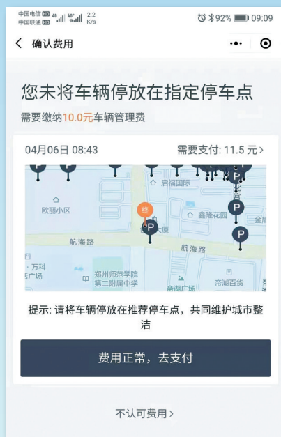
指定点外停车将收取调度费

停放难,是因为停车点位少、分布不均匀,点位上线需要区级城管部门审核流程,全市目前的实际停放点位是1.3万多处,主要集中在主次干道,支路背街的停