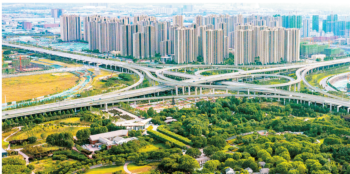
中原区荣获郑州市“月季花杯”园林绿化金杯奖