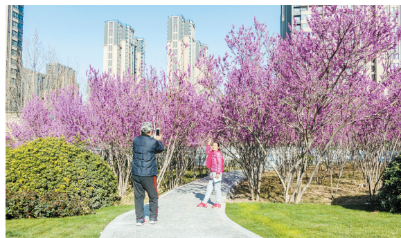
西三环汝河路东南角