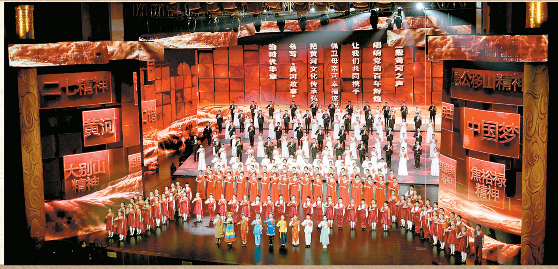
来自五湖四海的嘉宾，带着5000年中华文明的共同记忆，欢聚中原大地，共享艺术盛宴

随着“一条大河波浪宽，风吹稻花香两岸”的熟悉旋律响起，序篇《黄河岸边是我家》呈现在眼前，水墨画轴徐徐展开成一幅壮丽黄河的《千里江山图》，只见9名来自沿黄九省(区)的儿童，身着当地特色服饰，手捧当地最具文化历史意义的、盛满了当地黄河水的器皿，怀着对党的感恩之情和对祖国的深情祝福，高唱《我的祖国》。背景屏上，以建筑漫游的方式，写意地快闪出沿黄九省(区)多个城市的城市坐标、文化元素，黄河文化月系列活动发布的序幕就此拉开。 “我在这里等待了你千年!”第一篇章“河之魂”中，重点发布的是“黄河珍宝——大河流域文物精品展”。国家博物馆著名讲解员河森堡，与幻化出现的动漫“唐宫小姐姐”，在魔法般的特效帮助下，呈现出梦幻的舞台效果。这个利用全息影像技术打造的人屏互动节目《千年之约》，虚拟演示沿黄九省(区)博物院镇馆之宝，辅以动漫手段让文物“活”起来，让人与文物之间开展了一场诙谐有趣的对话。 “年轻人，年轻人，你盯着我看了很长时间了……”青海博物馆的“镇馆之宝”舞蹈纹彩陶盆通过新技术“活”了起来，与讲解员河森堡进行了一场诙谐有趣的对话，文物知识巧妙融于其中。舞蹈纹彩陶盆只是沿黄九省(区)带来的众多宝贝中的一个，想解锁更多国宝，4月30日~6月1日，不妨走进郑州博物馆新馆，从“黄河珍宝——大河流域文物精品展”中探寻黄河流域的瑰丽文物宝藏。