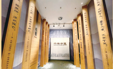
郑州博物馆新馆即将正式揭开神秘的面纱