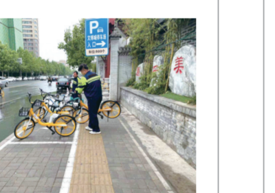
居民群众的环保意识,切实提升了辖区整体环境。

放、乱张贴、绿化带以及各死角垃圾进行集中清理。积极发动全民参与,充分调动居民群众、志愿者参与万人清洁活动和环境整治的积极性,主动融入全社会环境整治。同时,督促商户落实“门前四包”,自觉落实好应承担的责任。截至目前,共清理垃圾杂物30余处,清运楼院垃圾6车,整治卫生死角12处。 此次环境卫生大整治行动提升了辖区的环境面貌,也增强了