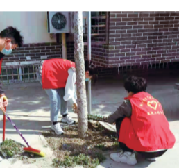
持续净化辖区环境,为深入推动爱国卫生运动奠定坚实人力资源基础。

物进行了集中清运,对卫生死角、盲区进行了彻底清除,对院内的杂草进行了清理,对楼道“小广告”进行了铲除。同时,积极引导居民养成文明卫生习惯,号召大家共同保护社区环境,杜绝随意占道堆放垃圾、杂物等不文明行为。 目前,爱国卫生运动如火如荼地开展。下一步,龙子湖街道办事处将继续动员辖区各高校、公共单位、“两新”组织,整合志愿服务资源融入爱国卫生运动,持