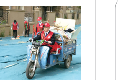
合垃圾约7立方米。下一步,办事处将继续加大清洁力度,不断改善人居环境,提升居民群众的幸福感。 记者 王阳 通讯员 王小丽 文/图

杂物乱堆等。同时,针对人工处置比较困难的地方,及时采用机械车辆协助,出动清扫车、扫水车等做好路面保洁工作,降低扬尘天气带来的空气污染,努力为辖区居民营造舒适的生活环境。 经过一上午的共同劳作,辖区的整体环境有了较大改善。周边的居民纷纷感叹,每周一次的“全城清洁”相当于给我们的家园做了一次“美容”,使得居民环境更加整洁卫生,日常生活更加有品质。本次清洁行动约出动130人、各类车辆9辆,使用各类工具约120个,清除卫生死角70处、混