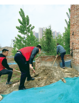
卫生志愿服务行动中,力争将人居环境整治理念深入人心。 记者 王阳 通讯员 柴丽真 文/图

挡后空地等点位生活垃圾、建筑垃圾等为整治重点,逐一排查卫生死角,高标准、大力度、连续性地开展全面整治,以积极认真的态度参与“清扫行动”,着力解决影响辖区环境的“脏、乱、差”等突出问题。全乡上下形成了“全员上阵、全民行动”的良好环境整治氛围。 此次志愿服务活动不但有效地改善了辖区公共卫生环境面貌,展现了文明、奉献的志愿服务精神,也引导群众增强了文明意识、卫生意识。下一步,圃田乡将继续发动更多志愿者参与到爱国