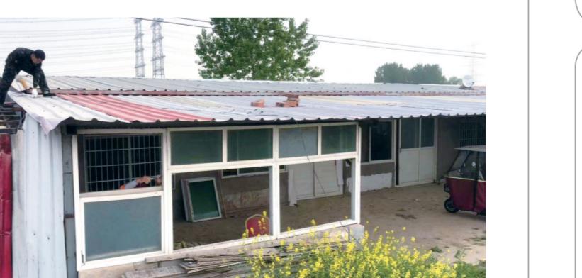
目前朱庄村临时过渡房正在清理,辖区其他村私搭乱建清理工作正稳步推进。 下一步,豫兴路办事处将定时定点,如期完成各村的私搭乱建、违法建筑清理和拆除,确保整治效果长期保持,杜绝反弹回潮现象的发生,为创卫工作贡献更多力量。 记者 王阳 通讯员 丁冬 文/图

本报讯 近日,豫兴路办事处组织村组干部在辖区各村开展私搭乱建、违法建筑专项整治行动。 在开展清理私搭乱建工作之前,豫兴路办事处组织朱庄村组干部开展了私搭乱建动员会,对工作目标、基本原则、工作职责、范围和重点等做了进一步解读,要求各村强化推进措施,协调机制,集中攻克难点,扎实推进私搭乱建、违法建筑专项整治行动。 豫兴路办事处从讲政治、讲法律、顾大局的高度出发,深刻认识开展专项整治的重要性和紧迫性,组织村组干部,用几天的时间,到群众家里帮助群众理解政策,进行劝说,在群众认可的基础上扎实开展清理工作。