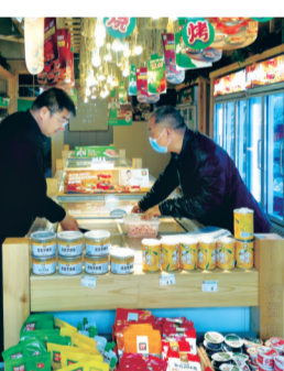
规范和管理,对辖区内“六小”门店不定期开展整治“回头看”行动,保持高压态势,节奏不变、力度不减、复查不停,为辖区居民营造一个健康卫生的消费环境。 记者 王阳 通讯员 董大力 文/图

防蝇设施、禁烟标识、消毒台账及食品安全等内容进行详细排查登记,分类梳理问题,建立“六小”门店整治工作台账,明确每个门店的具体问题和整治进度,实行整改销号制,全面整改、逐一销号,实现一抓到底。 狠抓落实,确保实效。联合相关单位对辖区“六小”门店进行定期摸底排查,对存在问题的门店,及时下达《“六小”门店整治通知》和限期整改通知书,责令其立即或限期整改。同时,安排专人采用“暗访+明察”的方式对“六小”门店进行不定期检查,严防问题反弹,确保取得良好整改实效。 下一步,办事处将继续加强