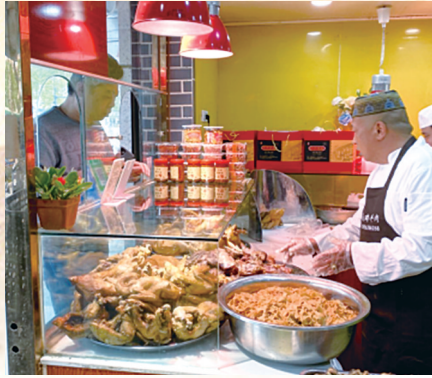
马记烧鸡制作技艺

氏点穴疗法。截至目前,管城回族区市级非物质文化遗产代表性项目达30个。本次入选项目都具有鲜明的特点,在全市众多非遗项目中具有代表性。其中,马记烧鸡、五顺斋烤鸭、西兰轩等管城回族区老字号特色美食相继入选。下一步,管城回族区将按照相关法律法规和政策规定,认真贯彻“保护为主、抢救