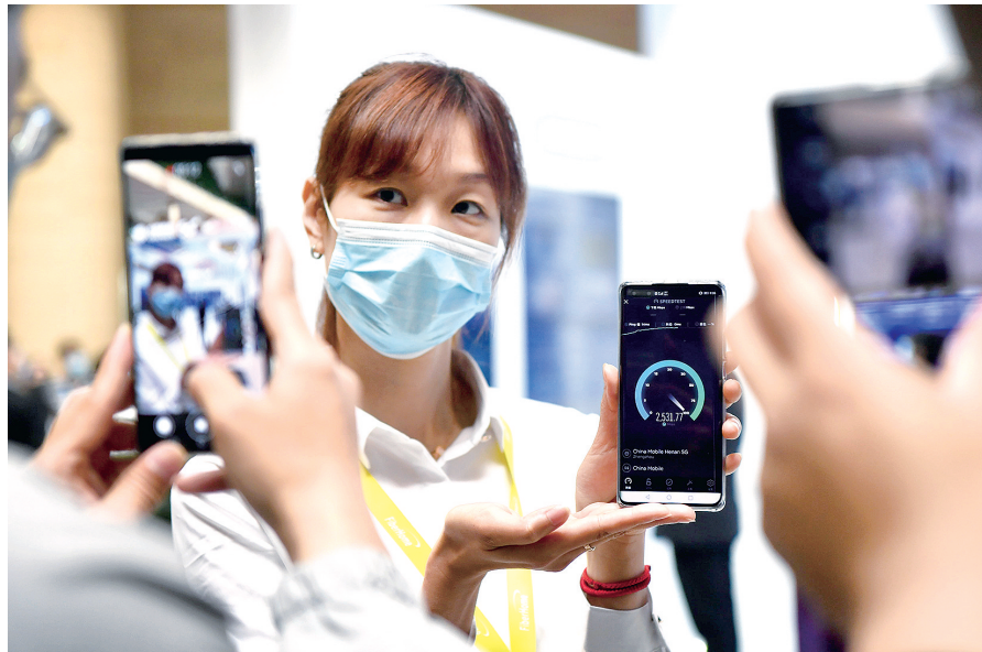
5月17日,工作人员在大会上用手机展示5G网络速度

8748.7万户。宽带接入端口总数达到4934.5万个。移动电话基站总数达到49.4万个。郑州国家级互联网骨干直联点总带宽达到1360G。互联网应用保持良好发展态势,即时通信、网络视频、网络新闻用户数分别达到8687万、7992.6万、7810.5万,渗透率分别达到99.3%、91.4%和89.3%,上云企业总数达到10.8万家,互联网业务经营单位总数达到4912家。