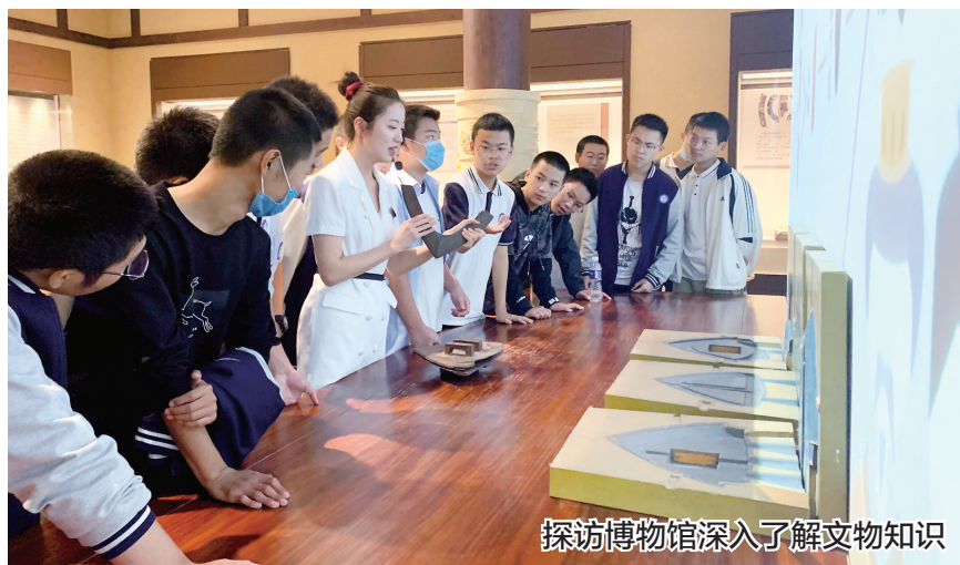
探访博物馆深入了解文物知识

新馆开展“共赴人间惊鸿宴”社会教育活动。届时将邀请热爱汉服文化的市民身穿汉服参观“黄河珍宝”“锦绣云霞”“豫声豫调”等展览,深入了解一件件精美绝伦的珍宝。此外,大家还可参与投壶游戏,在馆内设立的“汉服打卡区域”相见以礼,相悦以裳。