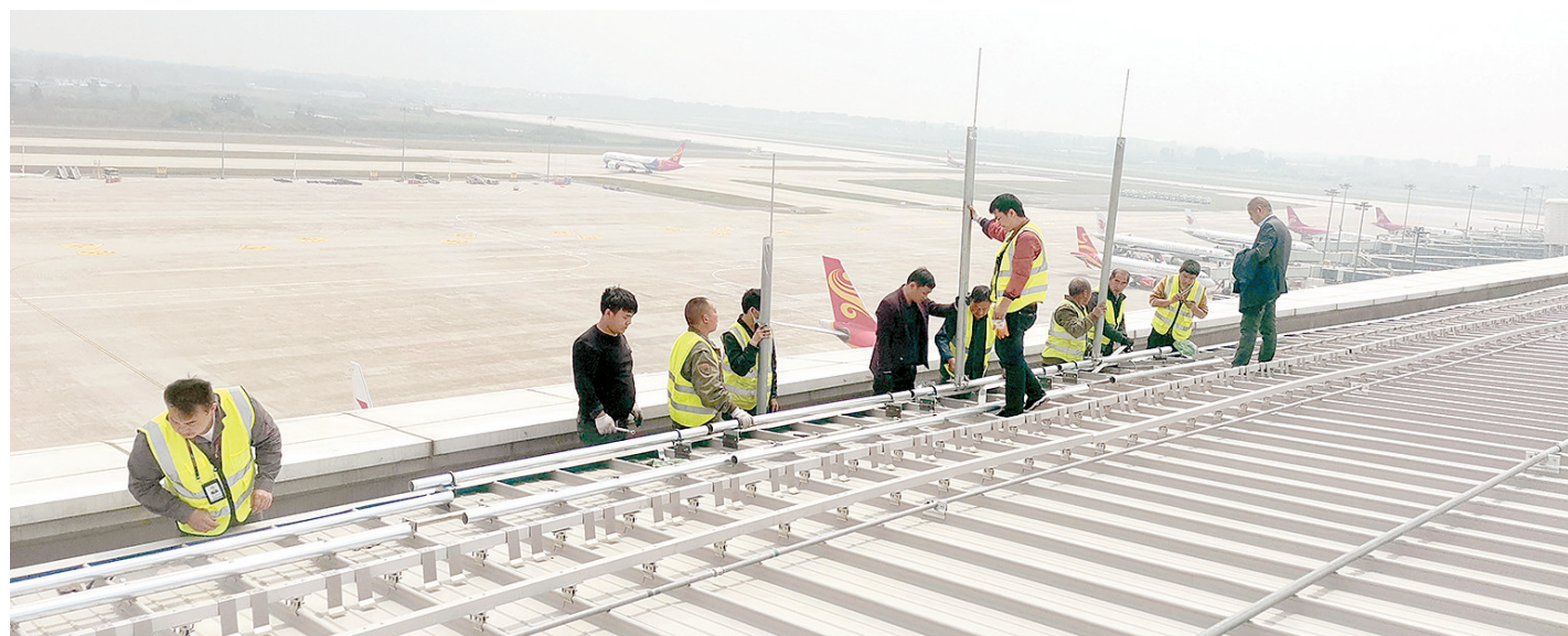
铁塔人在T2航站楼顶建设宏基站

同时,郑州铁塔坚持资源节约、环境友好的原则,以行业合作和社会共享的形式积极开展5G站址规划和站址资源储备,在更大范围内推进铁塔、室内分布系统、杆路、管道及配套共享,先后与电力、交通、公安等行业达成开放杆(塔)资源共识,通过共享社会杆塔、路灯杆、监控杆、电力塔、指示牌、建筑物、社会管道等可利用社会资源,实现网络信号的连续覆盖,减少城市杆塔数量。