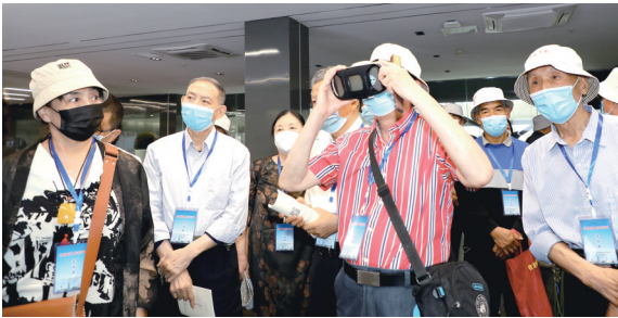
老记者戴VR眼镜感受智能家居