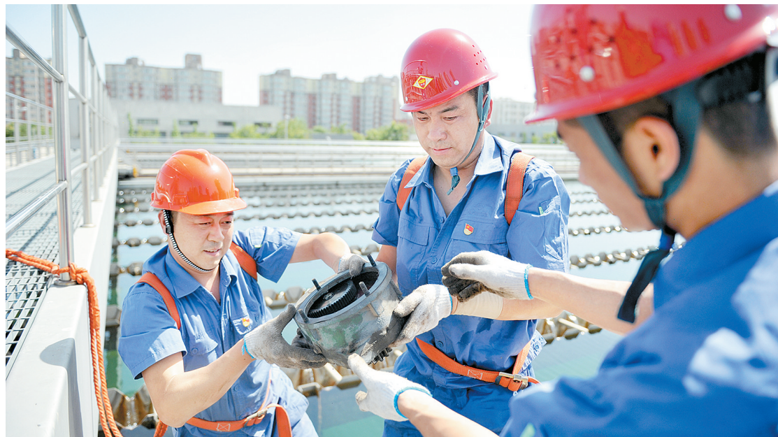
柿园水厂减少制水环节浪费

城区管网改造难,“一旦开挖,就要封路”。对此,郑州自来水公司2018年引进非开挖修复新技术,针对800毫米以上主管道,采取不锈钢内衬修复技术。2020年一年,通过不锈钢内衬修复技术已改造老旧管道19公里,2021年计划再改造20公里。