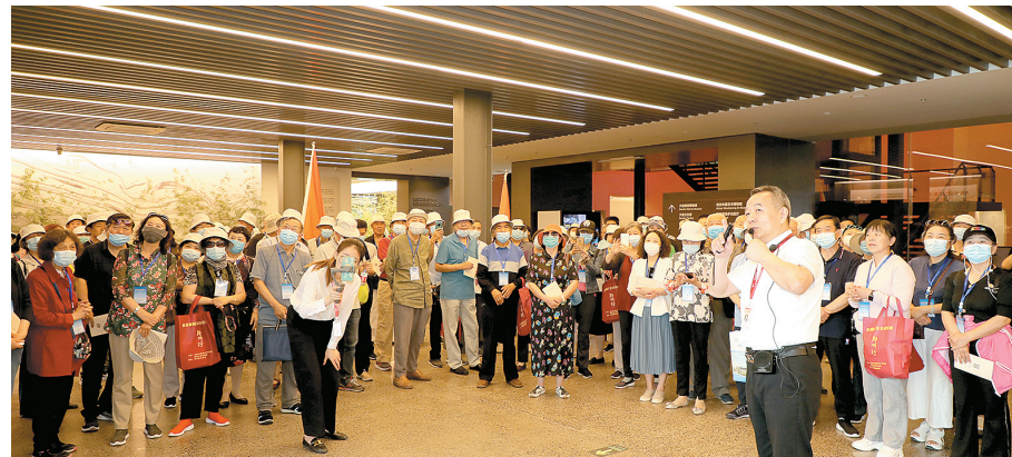
参观大信厨房博物馆