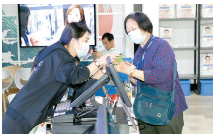
一位退休记者在中大门体验购物流程