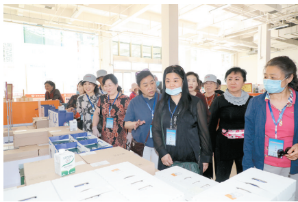
参观国际陆港郑欧班列进口商品展示体验中心