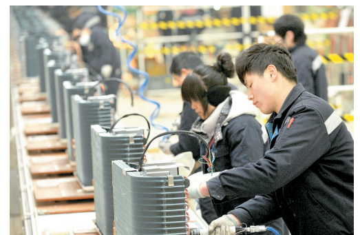
格力电器郑州产业园