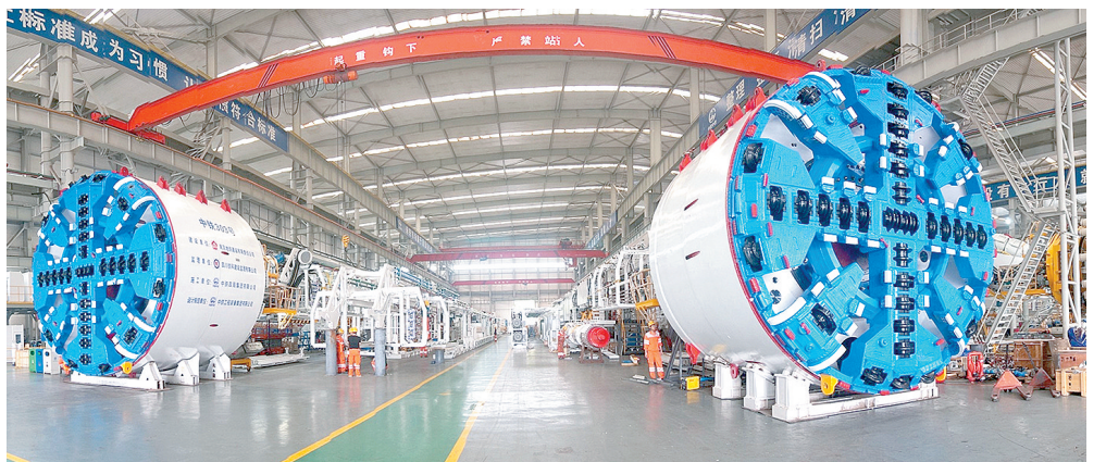
装备制造业——中铁工程

装点此关山，今朝更好看。今年是中国共产党成立100周年，是“十四五”规划的开局之年，也是郑州国家中心城市现代化建设进程中的关键一年。站在新的历史起点上的郑州，牢记嘱托谋出彩，奋勇争先再启航，正倾尽心力，实干笃行；继往开来，再著华章，一座充满无限希望和魅力的城市款款而来。 郑报全媒体记者 唐善普/文