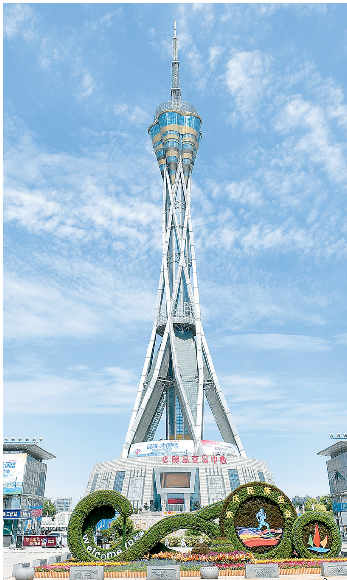
郑州地标性建筑中原福塔