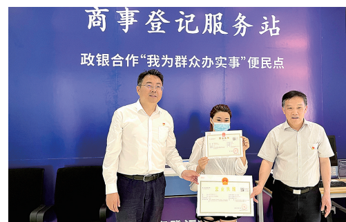
客户代表现场体验商事登记“一站式”服务