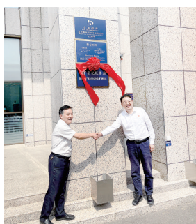
商事登记服务站启用

6月8日,郑州高新区市场监督管理局与交通银行郑州高新区支行“政银合作”,“商事登记交通银行服务站”正式成立。今后,个体户在交通银行郑州高新区支行可以实现“只进一扇门”,即可“一站式”办理全程电子化工商登记、营业执照自助领发、各类印章刻制、对公账户开立、银行结算和融资一体化服务。双方强强合作,将数字化应用于群众服务,实现让数据多跑路、群众少跑腿,努力实现让群众“最多跑一次”的发展愿景。