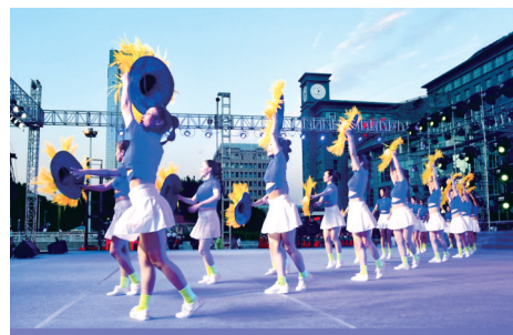
开场舞《最美·小康梦》

一百年风起云涌,一百年潮起潮落,回望中国共产党不平凡的奋斗历程,现场的每位观众都感受到爱党爱国的情愫在升腾。中牟儿女有信心有底气,奋勇争先谱写郑州国家中心城市东部新城现代化建设崭新篇章。记者 张朝晖 通讯员 张丹 刘亚峰 文/图