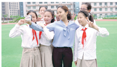
经开区瑞锦小学的学生与老师合影留念