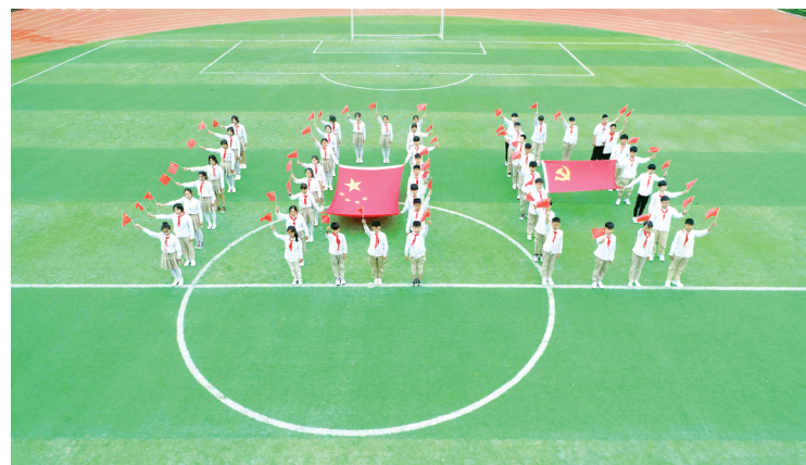
经开区瑞锦小学的学生拍摄创意毕业照