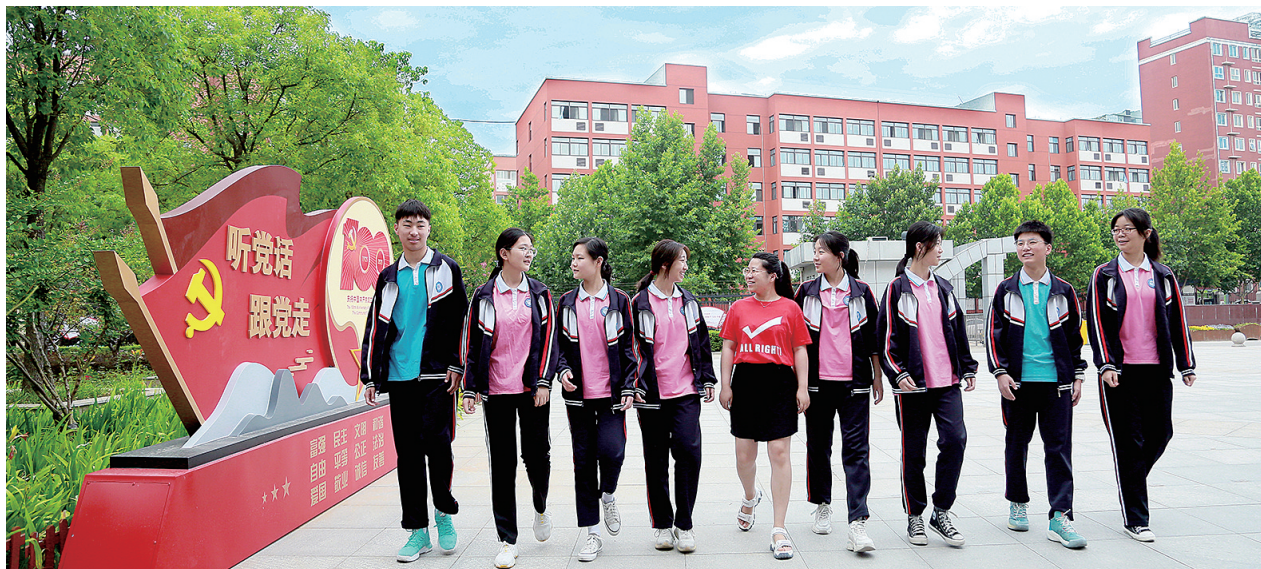
郑州八十五中学的师生在校园里畅谈未来

八十五中学子们,愿你们在未来日子里,无论是艳阳高照、晴空万里,还是风霜雨雪、严冬相逼,请你们时刻铭记,郑州市第八十五中学不仅是你们曾经的温暖港湾,也将永远是你们拼搏路上的加油站。