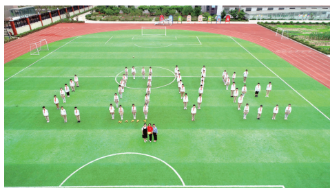
经开区瑞锦小学的学生拍摄创意毕业照