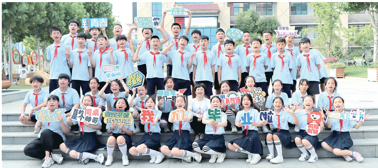
经开区滨河第一小学的学生们拍毕业照