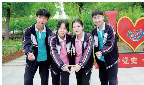
郑州八十五中学的学生们在校园里拍合影