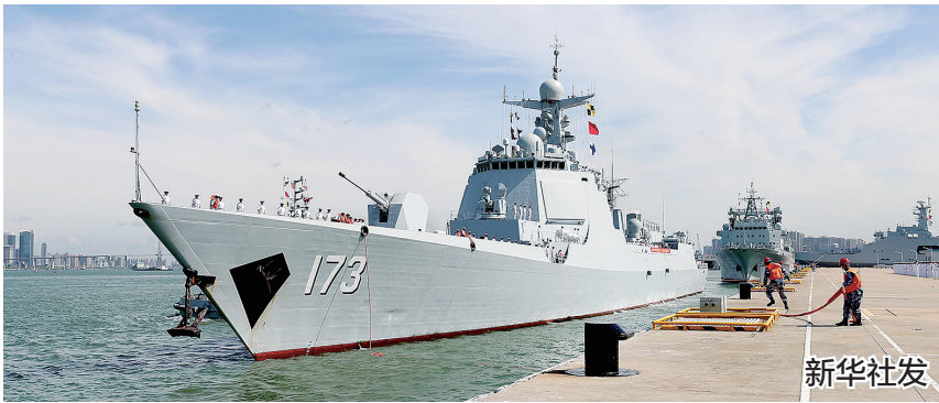
28艘我国商船执行特护任务、11艘过航商船提供安全监控,确保被护船舶安全航行,圆满完成40批64艘中外船舶护航任务。

新华社电 中国海军第37批护航编队圆满完成亚丁湾、索马里海域护航任务,于29日上午顺利返回湛江某军港。任务历时165天,航程9万余海里,全程未靠港休整。 中国海军第37批护航编队由导弹驱逐舰长沙舰、导弹护卫舰玉林舰和综合补给舰洪湖舰组成,1月16日从三亚某军港解缆启航。此次任务中,编队合理调控护航兵力、灵活组织护航行动,先后查证驱离15批24艘可疑小艇,为16批