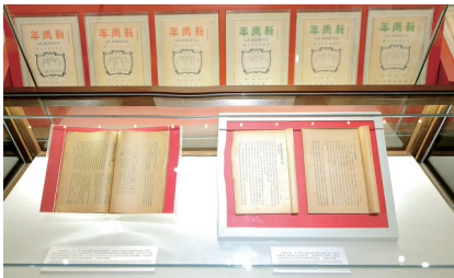
在北大红楼拍摄的刊登李大钊《布尔什维主义的胜利》《我的马克思主义观》的《新青年》原件

的119室,悬挂着李大钊亲笔手书的“铁肩担道义,妙手著文章”,笔法苍劲有力。1918年10月到1922年12月,李大钊在此工作。 同日向公众开展的主题展览共设置了67个展室,展出图片958张、文物1357件,其中,展出的文物原件有550多件,特别珍贵的文物70多件。其中一件特别珍贵的文物是李大钊1919年9月在《新青年》上发表的《我的马克思主义观》原件。