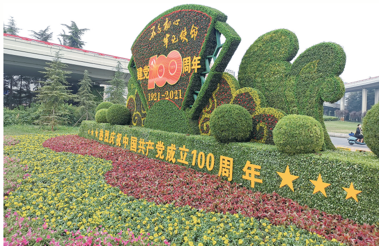
庆祝建党100周年,城管部门街头布置的绿雕景观