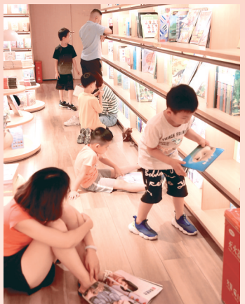
7月4日,金水区一书店内,家长带孩子在看书

近几日,天气炎热,市区各大书店和图书馆内人气旺,很多孩子利用假期在书店里看书,既可以避暑,又可以学习知识。