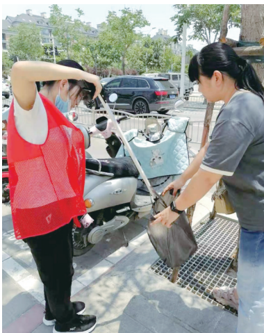
自觉维护美好的生活环境,享受辛勤劳动带来的成果,不断提高幸福指数和文明程度。

下一步,联盟新城社区将在防控疫情的各项工作的基础上,把爱国卫生工作作为常态工作,让辖区居民自