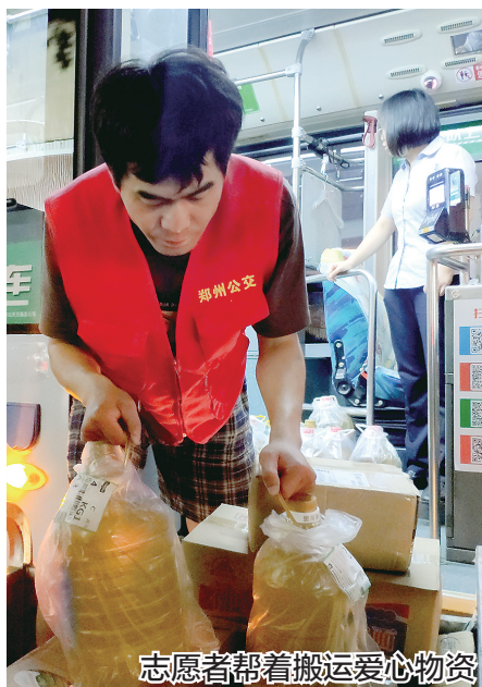
志愿者帮着搬运爱心物资