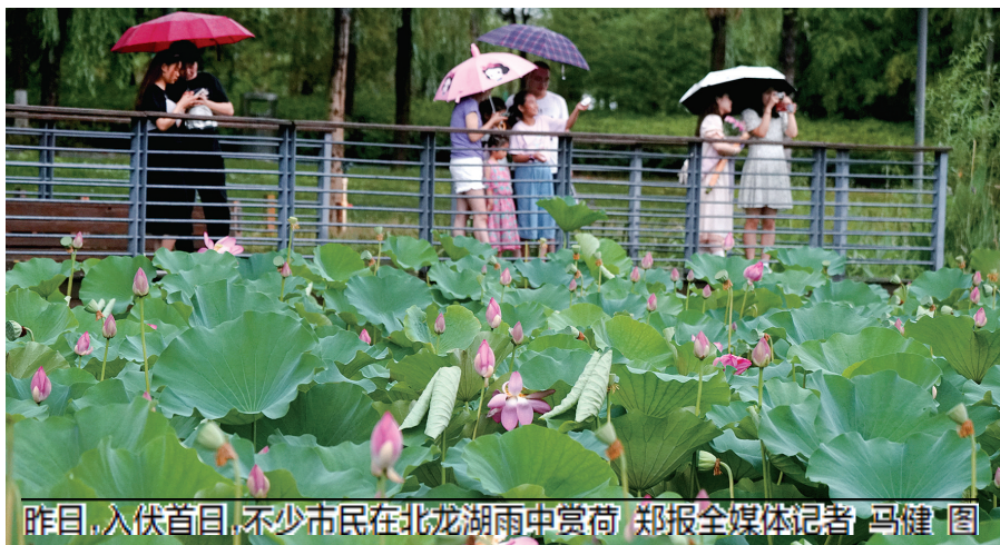
昨日,入伏首日,不少市民在北龙湖雨中赏荷

此外,受强降雨影响,昨日,省内焦作云台山、青天河,安阳红旗渠、太行大峡谷,新乡宝泉、南太行旅游度假区等多家景区发布暂停开放公告,恢复开放时间将根据天气情况另行通知,公众可关注景区微信公众号。