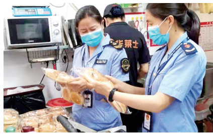
端午节前夕,对商超节日食品进行检查