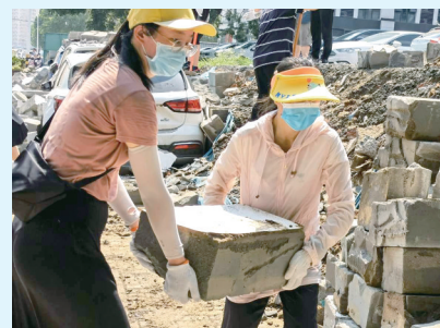
清理被水冲毁的建筑