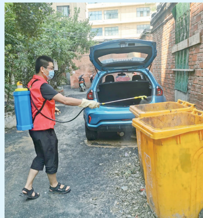
居民自发组成“小区消杀队伍”,对楼院进行全方位、无死角清洁消杀

据了解,二七区为充分发挥群众的主体作用,牢固树立人民至上、生命至上理念,通过组建“一核多元”组织体系,成立“我为群众办实事”灾后恢复工作指挥部,精准收集各乡镇(街道)灾情信息,科学调配机关干部下沉力量和广大群众志愿者,一对一认领并解决问题。截至目前,全区“两通一排”“两清一消杀”加快推进,居民群众生产生活秩序正在得到较好恢复。