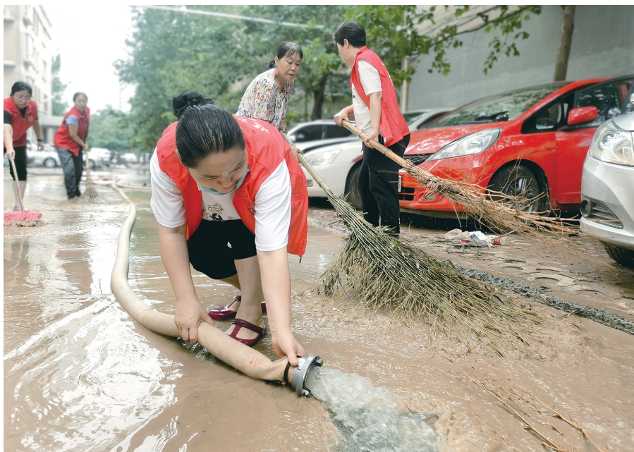
群众和志愿者自发参与到老旧小区楼院清淤排水自救中

目前,全区已成立340个楼院临时党支部,102个灾后恢复任务重点楼院均建立了微信群工作平台,切实把组织建起来、强起来,作用充分发挥出来。