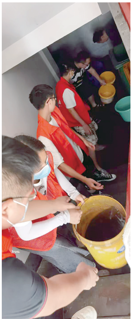
志愿者在社区清理积水