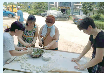
居民自发包饺子送给救援队伍