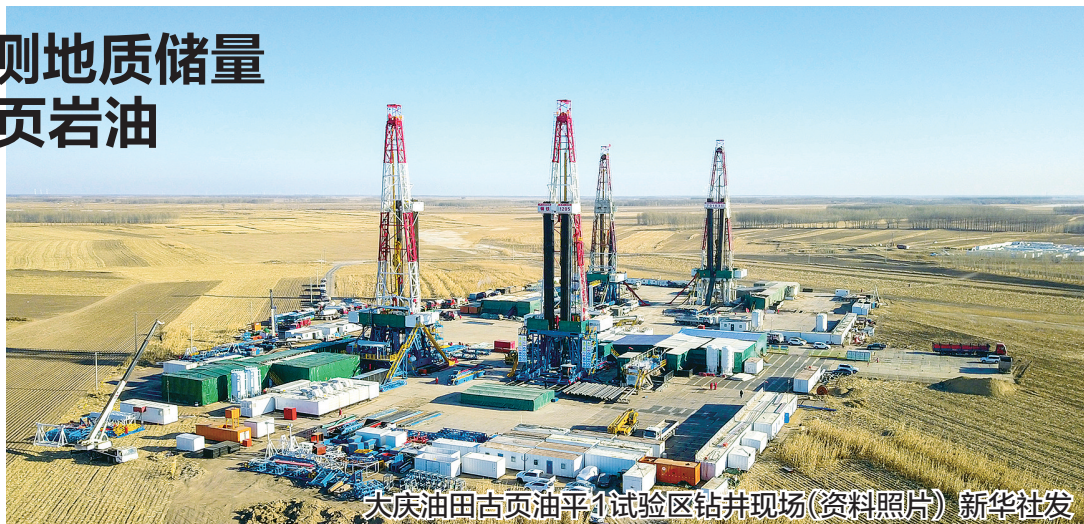
大庆油田古贡油平1试验区钻井现场(资料照片)

8月25日,中国石油大庆油田对外发布消息,大庆油田依靠自主创新,发现预测地质储量12.68亿吨页岩油,标志着我国页岩油勘探开发取得重大突破,对于保障国家能源安全、推动页岩油气产业发展具有重要意义。