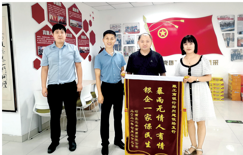
高效服务助力企业渡过难关