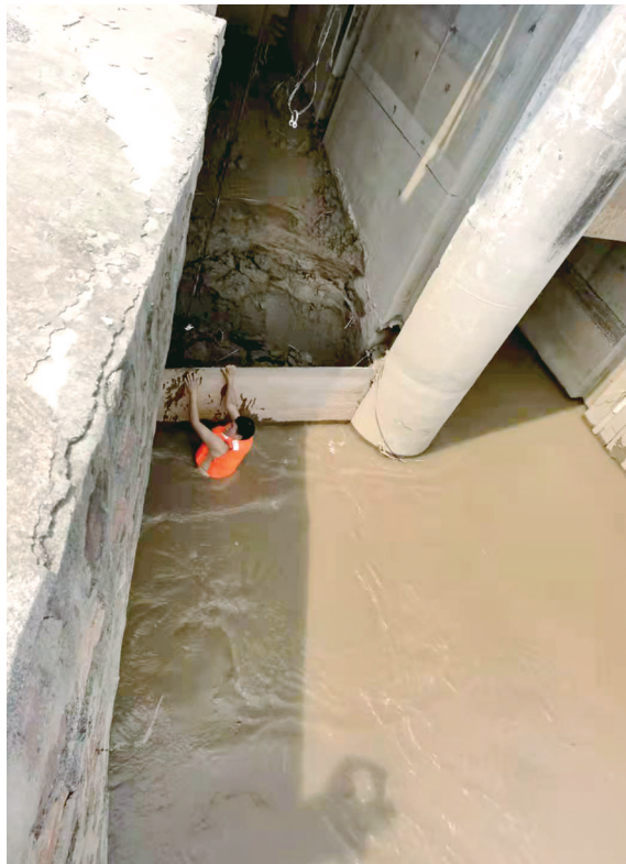
泡在黄河里，白庙供水公司原水厂职工清理淤泥

自来水并非自来，对白庙供水公司原水厂的员工来说，一点一滴都是从黄河里“抠”出来的。受“7·20”暴雨影响，从7月22日起，为保障市民供水，郑州自来水公司紧急启动黄河备用水源，白庙供水公司原水厂抢修人员连续十几天泡在黄河水里，用责任和担当打通郑州北区供水生命线。