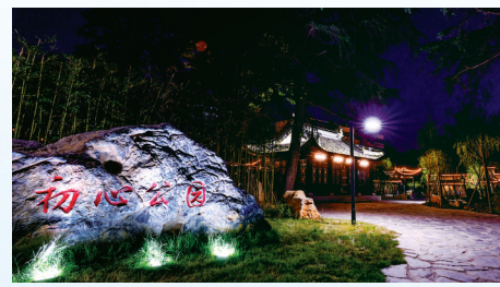
人在城中走，景在身边行