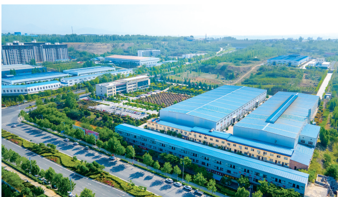
科技创新驱动工业转型升级