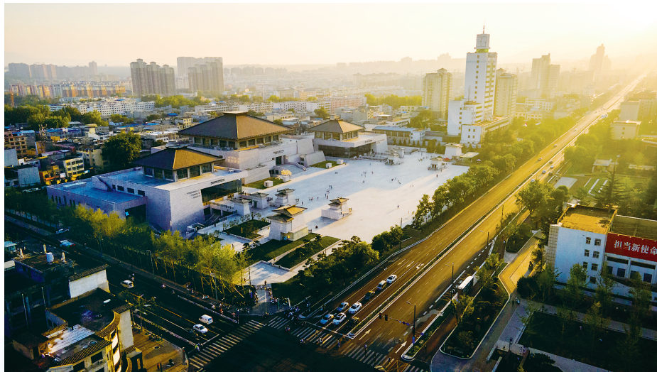
市民文化中心，美丽登封新名片