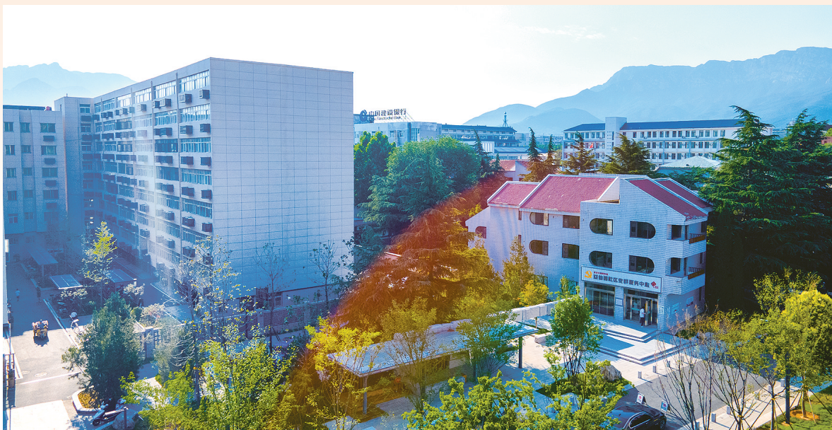
“完整社区”，珍藏登封人的幸福