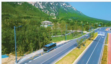
环山旅游公路升级改造