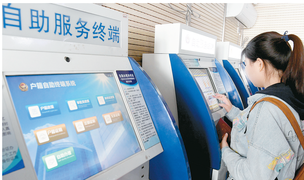
市民在自助服务终端上办事

昨日,市十五届人大常委会第二十八次会议听取了市政府关于贯彻执行国务院《优化营商环境条例》《河南省优化营商环境条例》有关情况的报告。报告提到,郑州连续三年在省营商环境评价中位居第一,一流营商环境正在成为“国家队、国际化”的新标识。郑报全媒体记者 董艳竹