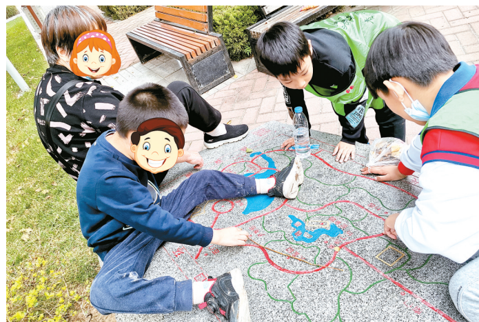
志愿者与自闭症儿童家庭一起做游戏

本报讯(郑报全媒体记者 汪永森 通讯员 连祥工 文/图)10月31日,由郑州慈善总会、郑州社会工作协会主办,郑州市康达能力训练中心、金水区星光社会工作服务中心、青少年义工团承办的“家庭手牵手,相约大自然”特殊儿童家庭融合活动在郑州植物园火热开展,来自全市的20组普通家庭和16组自闭症儿童家庭结对组合,度过了一个美好的上午。