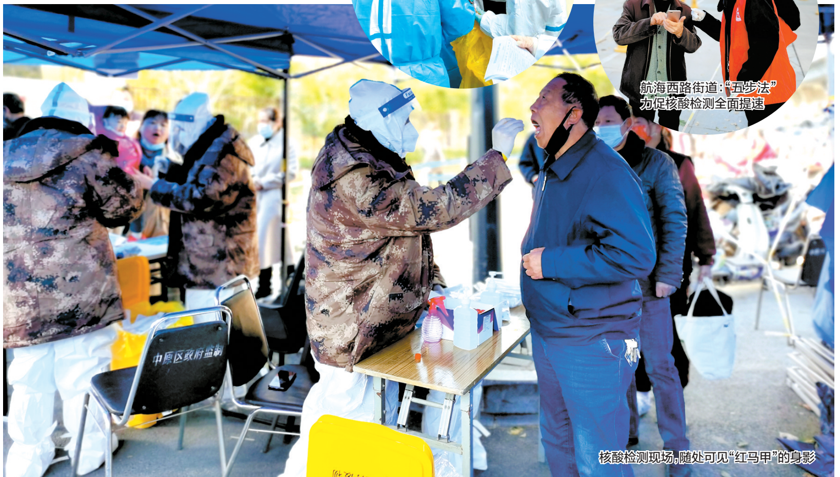
核酸检测现场,随处可见“红马甲”的身影