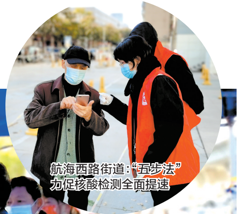
航海西路街道:“五步法” 为促核酸检测全面提速